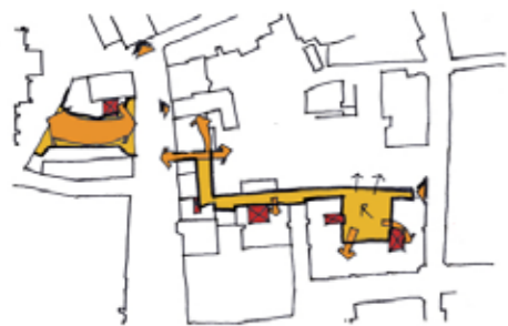
De nieuwe ontsluitingsstructuur verbindt en oriënteert