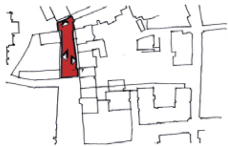
Gemeenteplein met drie prominente adressen