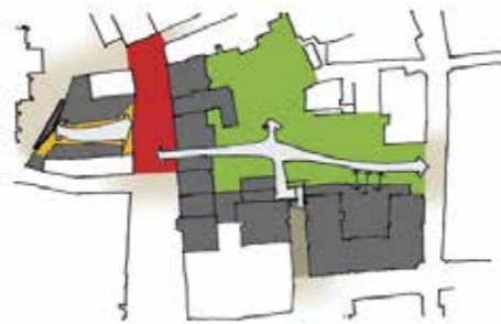
De nieuwe openbare route