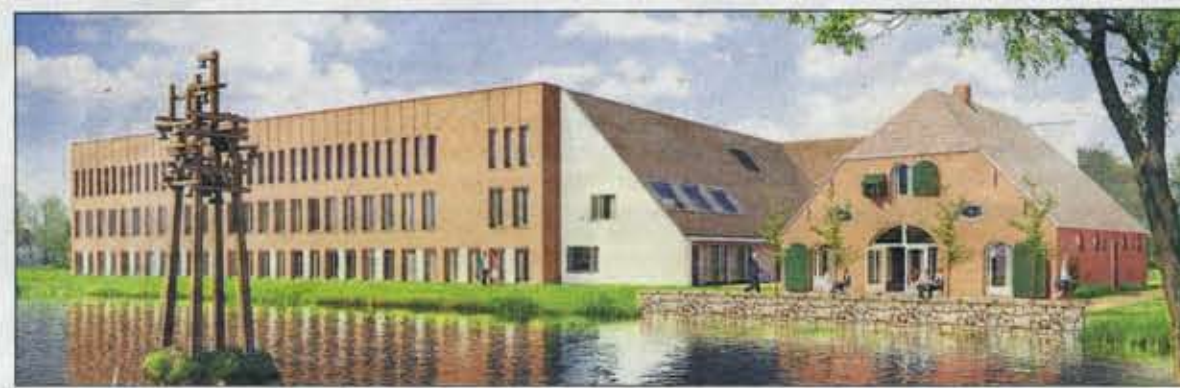
Zicht op de zuidvleugel. Onder het schuine dak vooraan is de entree.