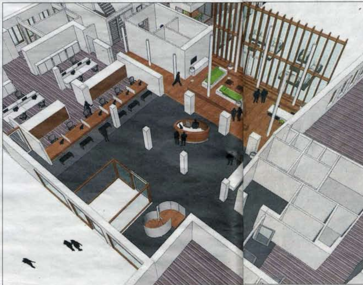
De ontvangthal, met linksonder de entree, links de balies en rechtsboven de zithoek.