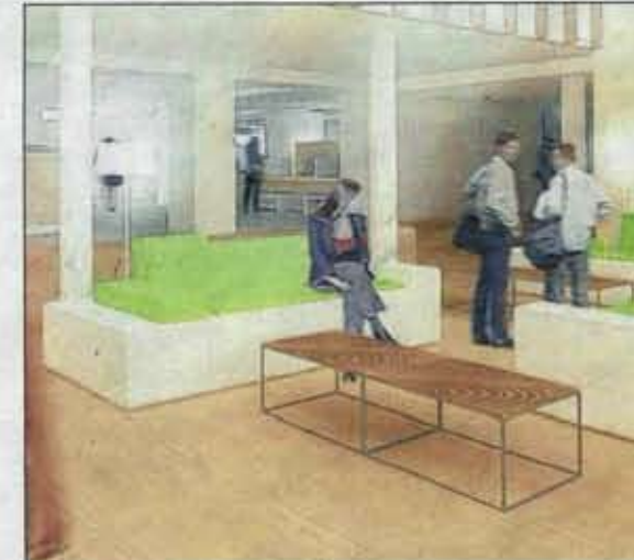
De zithoek in de ontvangthal. Hier kan men 'met overzicht en rust' wachten.