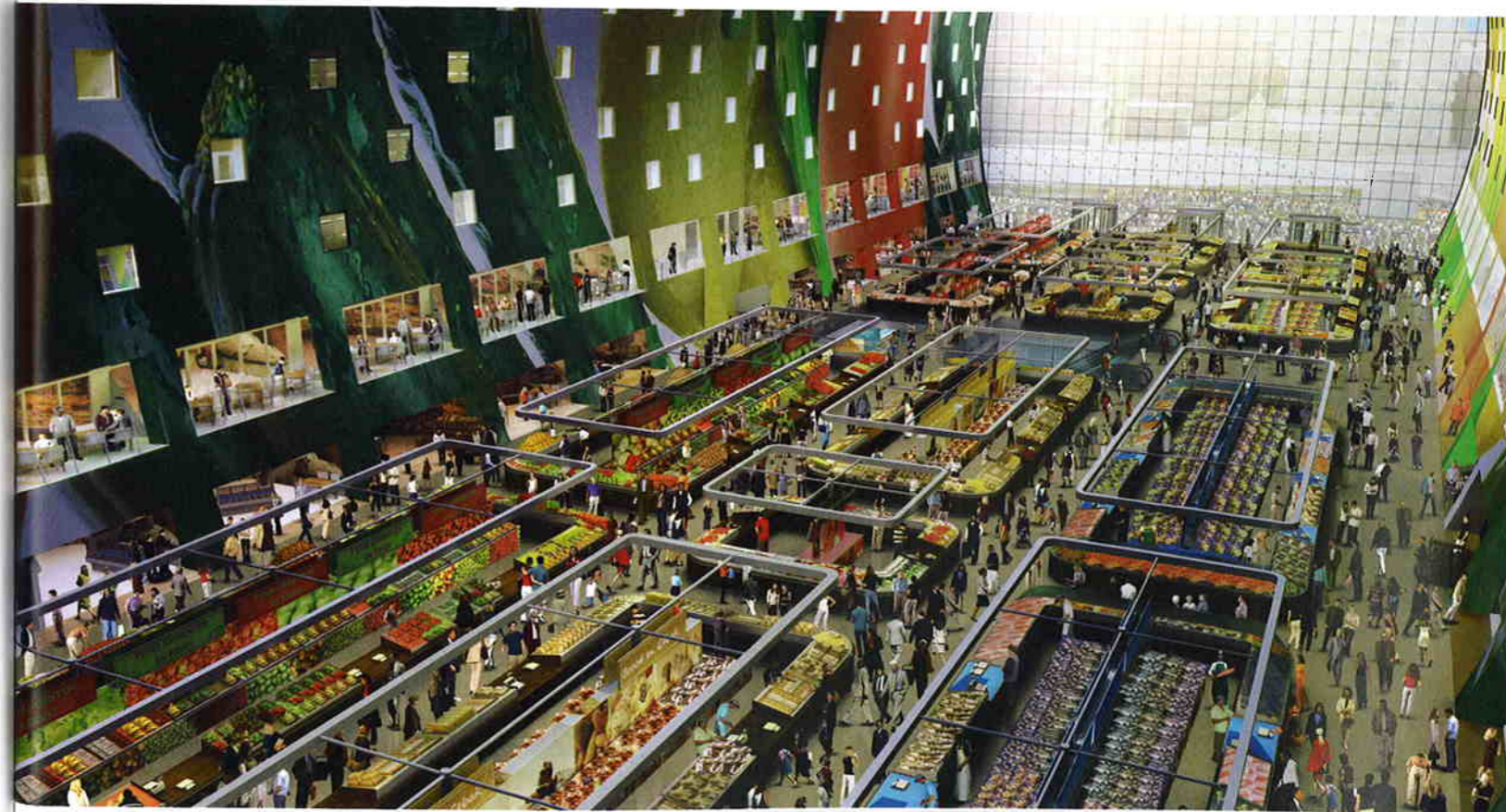
Een galerij op de eerste verdieping verbindt de twee lagen. Op de koppen van de hal komen terrassen, bovenin de Markthal 246 appartementen.