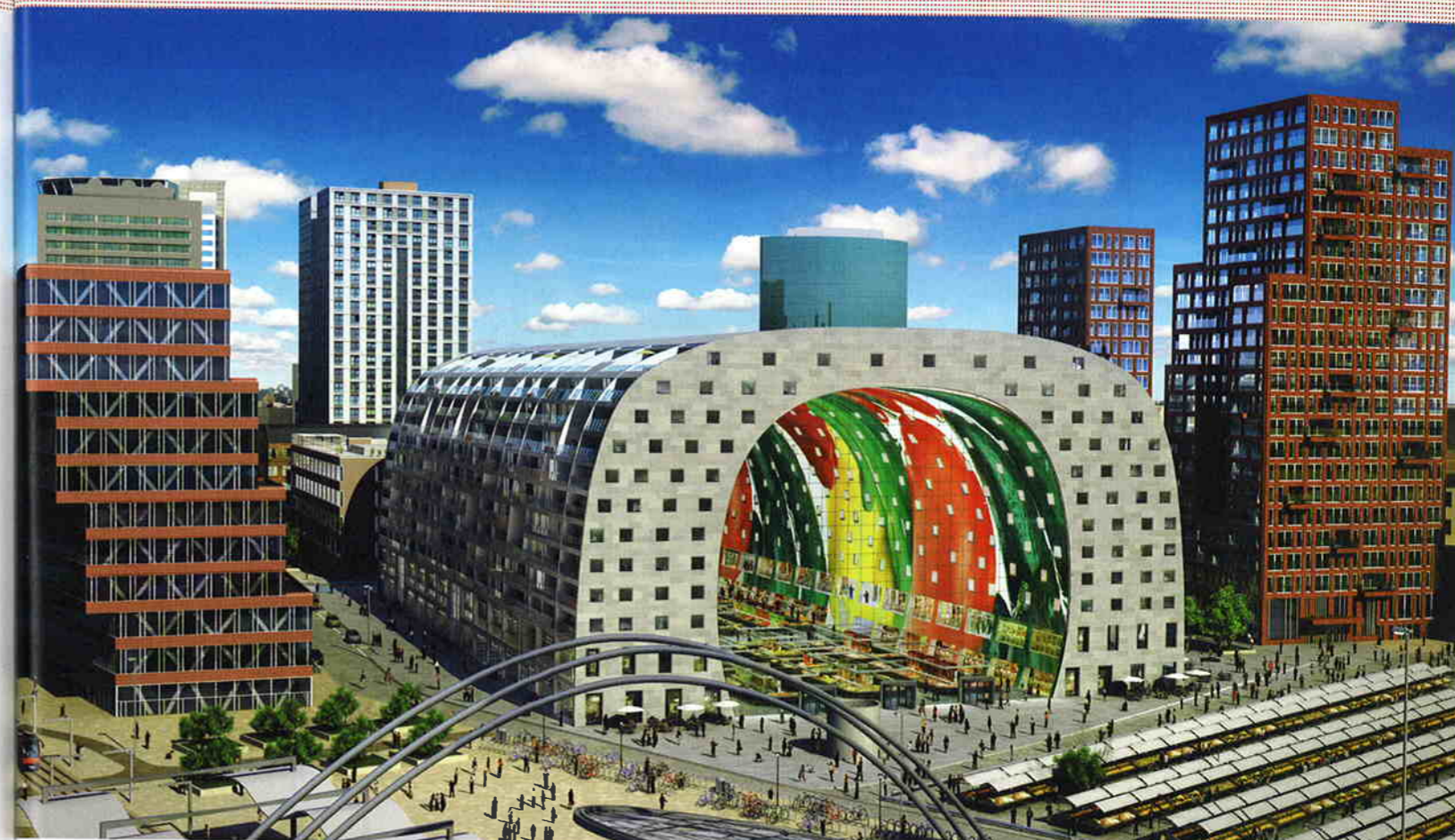
De Markthal biedt ruimte aan 110 permanente en losse marktkramen. Door wetgeving is het op termijn nauwelijks meer toegestaan om in de buitenlucht voedsel te verkopen.

Markthallen in grote steden, zoals deze in Lissabon, liggen vaak enigszins perifeer, nabij de (oude) aanvoerplaats van de te verkopen goederen.