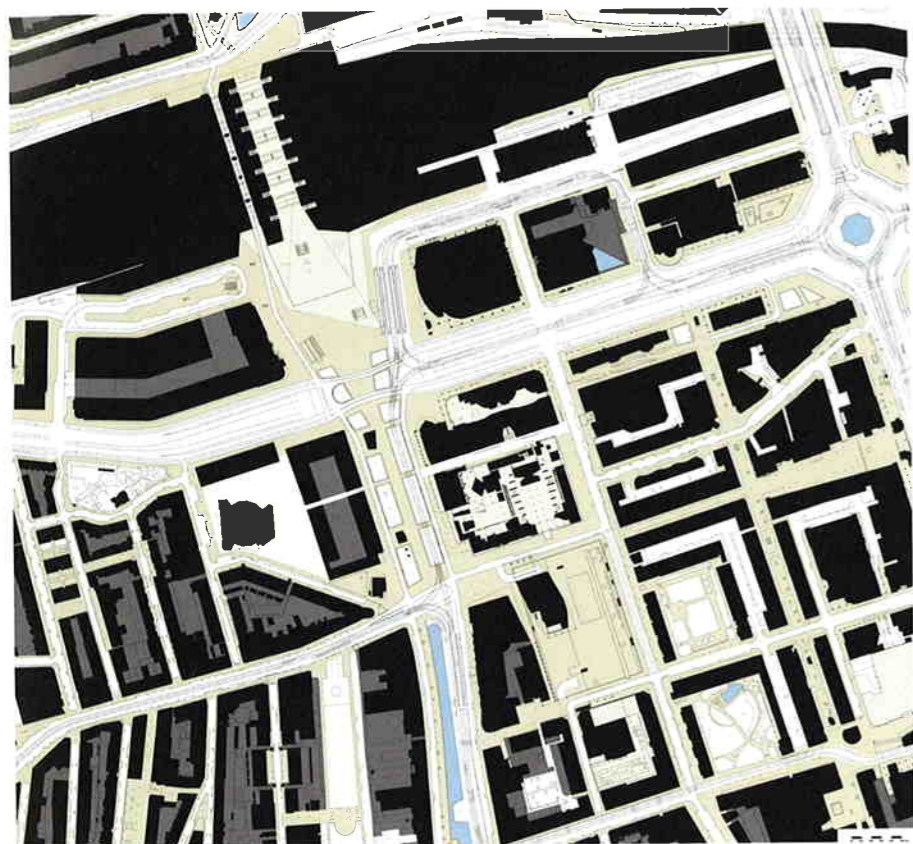
De Nollikaart van het centrum van Rotterdam geeft het voetgangersgebied aan.

In onze steden wordt de komende jaren een flink aantal gebouwen opgeleverd die in grote mate openbaar toegankelijk zullen zijn. Deze gebouwen krijgen daardoor naast hun specifieke functie ook een zeker informeel gebruik. Een greep uit actuele initiatieven in het altijd dynamische Rotterdam: het nieuwe Centraal Station, het Coolingselblok, het Erasmus Medisch Centrum, de herontwikkeling van het postkantoor, het nieuwe Stadskantoor en de Markthal. Het is de moeite waard deze gebouwen of complexen te beschouwen met openbaar interieur als invalshoek, omdat daarmee voor een belangrijk deel de betekenis ervan voor de kwaliteit en het functioneren van de stad wordt bepaald. Publieke interieurs accommoderen de ontmoeting in ruimtes met andere kwaliteiten dan straten en pleinen. Dit zijn de plekken waarvoor mensen de stad in gaan, voor een toevallige ontmoeting, vrijblijvende contacten, of voor een sociale, romantische of zakelijke afspraak.