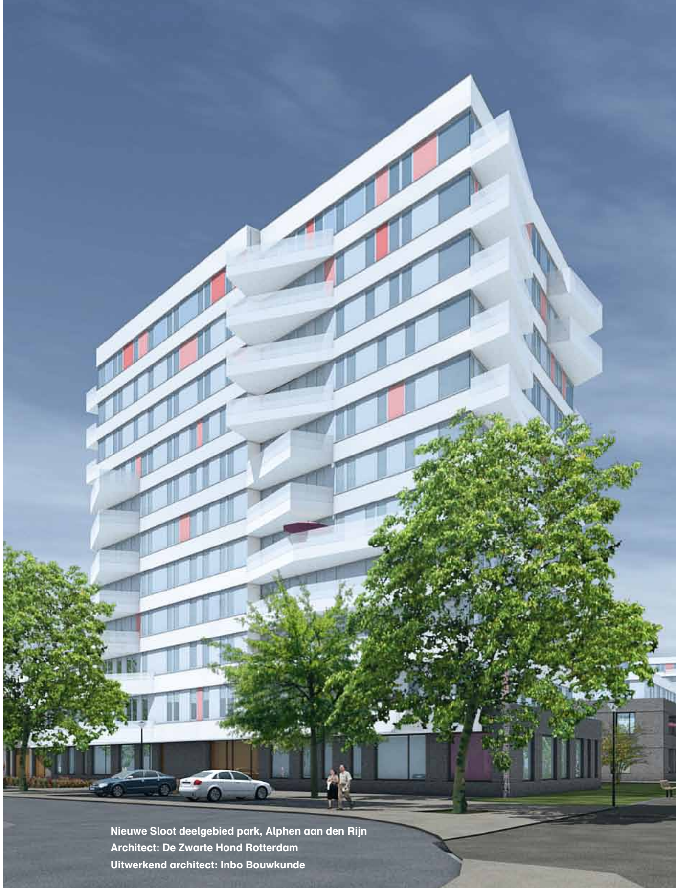
Nieuwe Sloot deelgebied park, Alphen aan den Rijn Architect: De Zwarte Hond Rotterdam Uitwerkend architect: Inbo Bouwkunde