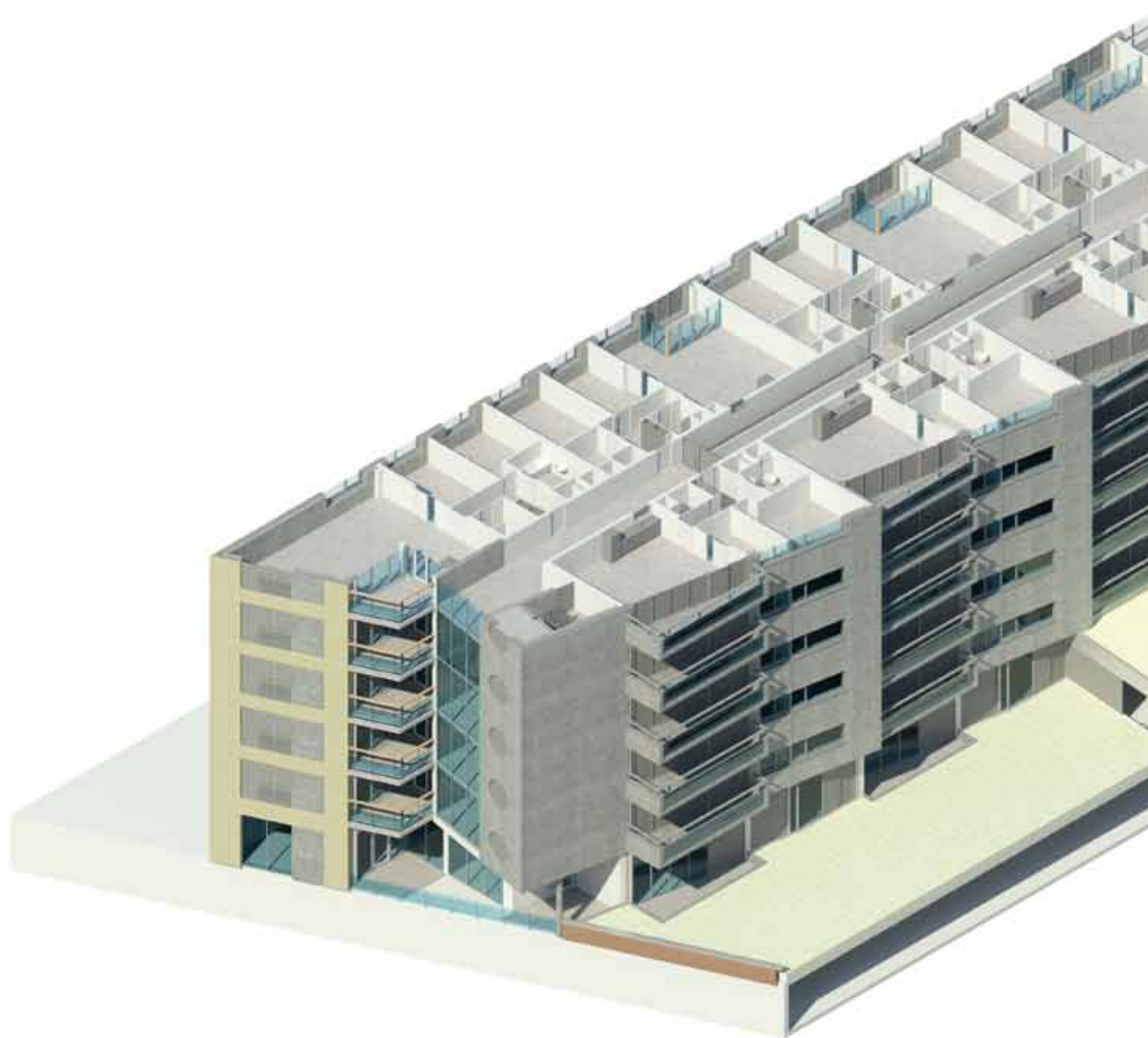
De Veranda Blok H+I, Rotterdam Architect: Rudy Uytenga Architectenbureau Uitwerkend architect: Inbo Bouwkunde